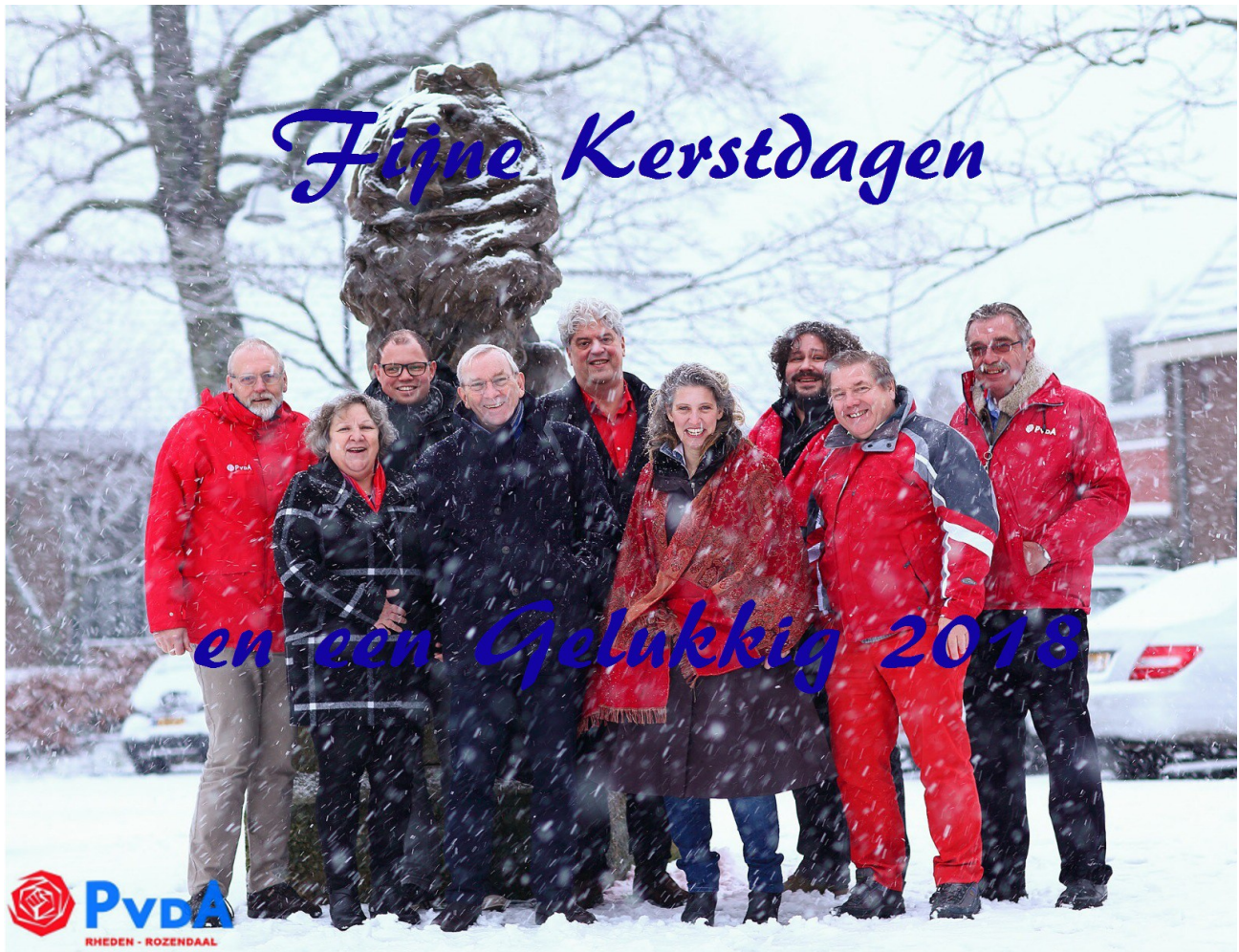
Mede namens alle kandidaten voor de Gemeenteraadsverkiezingen Fijne Kerstdagen en een gelukkig 2018